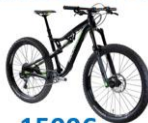
AM 100 S 27,5" Plus