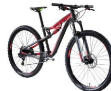
XC 100 S 1200€