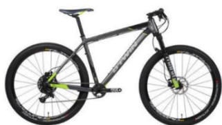
ROCKRIDER 900 800€