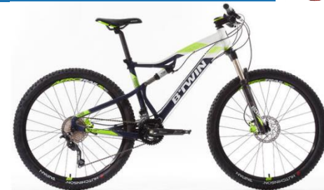
560 S 900€