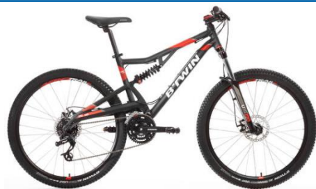
520 S 400€