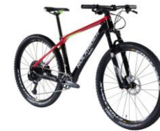
XC 900 1600€