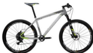
ROCKRIDER 920 1000€