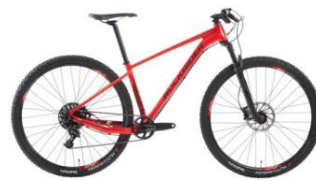
XC 500 1100€