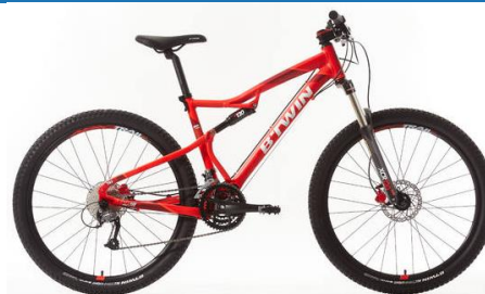
540 S 600€